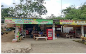
Gambar 4.6 Setelah Objek Wisata Pemandian Air Panas Selesai Dibangun