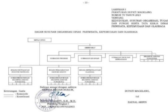
Gambar 4. 3 Bagan Susunan Organisasi Disparpora Kabupaten Magelang

h. Pelaksanaan fungsi lain yang diberikan oleh bupati terkait dengan tugas dan fungsinya.