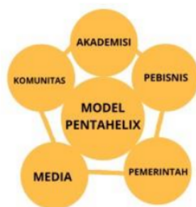
10 Gambar 1. 1 Model Pentahelix