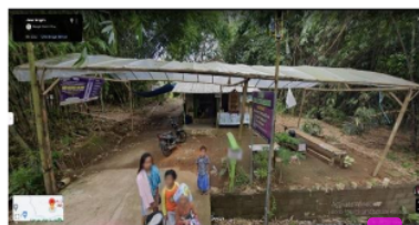
14 Gambar 4. 5 Kondisi Warung Ma'ruf Setelah Adanya Objek Wisata Pemandian Air Panas

Analisis Manajemen Kolaboratif Model Pentahelix Sebagai Strategi Pengelolaan Objek Wisata Pemandian Air Panas Desa Sumberarum Kabupaten Magelang