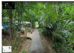
14 Gambar 4. 4 Kondisi Desa Sumberarum Sebelum Adanya Objek Wisata Pemandian Air Panas

Adanya objek wisata pemandian air panas ini dapat mengangkat perekonomian warga sekitar terkhusus di Desa Sumberarum. Seperti halnya warga sekitar yang memiliki warung sembako yang menjual keperluan mandi, bensin, dan makanan kering lainnya yang dahulu hanya orang – orang Desa Sumberarum yang mampir membeli saat akan pergi ke sawah atau bahkan beberapa orang yang mandi karena percaya dengan manfaat air panas ini. Namun, sekarang dengan adanya objek wisata ini perubahan pun terjadi dari kondisi tempat maupun pendapatan yang dihasilkan oleh warga setempat. Di mana dahulu depan warung hanya kebun milik warga dan suasana sepi, tapi sekarang depan warung sudah ada objek wisata pemandian air panasnya dan sangat ramai tiada henti orang yang mampir di warung – warung milik warga tersebut.