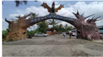
Gambar 4.7 Objek Wisata Pemandian Air Panas Az-zira Tirta Gemilang