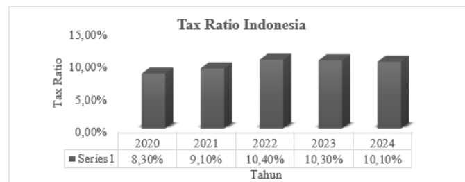
Gambar 2. Tax Ratio Indonesia Tahun 2020-2024.

Akan tetapi, peningkatan tersebut tidak disertai oleh kenaikan tax ratio yang signifikan, bahkan cenderung menurun setelah tahun 2022. Kondisi ini mengindikasikan adanya kesenjangan antara potensi dan realisasi penerimaan pajak.