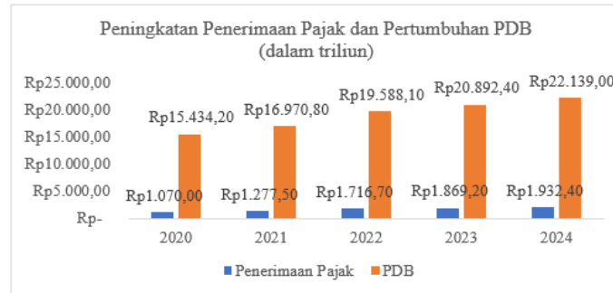
Gambar 1. Penerimaan Pajak dan Pertumbuhan PDB Tahun 2020-2024.

Akan tetapi, peningkatan tersebut tidak disertai oleh kenaikan tax ratio yang signifikan, bahkan cenderung menurun setelah tahun 2022. Kondisi ini mengindikasikan adanya kesenjangan antara potensi dan realisasi penerimaan pajak.