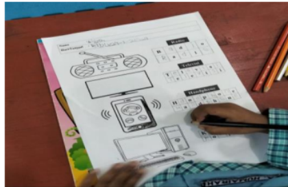
Gambar 1. Proses anak didik mengerjakan tugas melalui media wordwall

penerapannya yaitu terdapat kosakata komputer dilanjutkan anak tersebut menyusunnya dalam papan scrabble agar membentuk menjadi kata komputer, peletakkan keseluruhan kosakatnya berada disamping kanan papan scrabble bertujuan agar memudahkan anak untuk mencari satu persatu kata agar membentuk menjadi kata yang benar.