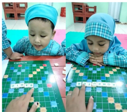
Gambar 4. Hasil penyusunan kosakata Daru dan Qalesya melalui game scrabble words

Kriteria absolut berasal dari sumber yang ideal, maksudnya capaian hasil yang diperoleh selama penelitian bisa dikatakan sudah sesuai pada teori yang relevan dengan yang digunakan peneliti saat penelitian. Hal tersebut dapat dibuktikan melalui penjelasan pendidik bahwa anak-anak mengalami peningkatan kecakapan kosakata walaupun dengan cara yang bertahap, karena dengan penerapan media pembelajaran wordwall