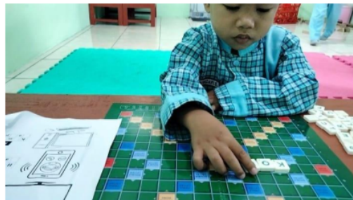
Gambar 2. Pemberian kesempatan kepada anak didik untuk bermain game scrabble words

Kegiatan penutup pembelajaran, hasil yang diperoleh dari anak didik selaku penerima manfaat yaitu mereka mampu mengikuti dan memahami setiap tema materi yang diberikan oleh pendidik dengan penggunaan media pembelajaran wordwall melalui game scrabble words . Kemudian pendidik memberikan kesimpulan terkait dengan tema materi hari itu, dengan cara menyimpulkan materi secara keseluruhan dari awal hingga akhir dan mengulang penjelasan terkait materi sebelumnya agar anak-anak bisa terus menerus mengingatnya. Penjelasan tersebut selaras dalam (Steed et al., 2022) bahwa memberikan tindakan di akhir kegiatan belajar mengajar akan membentuk dukungan bagi pendidik secara structural,