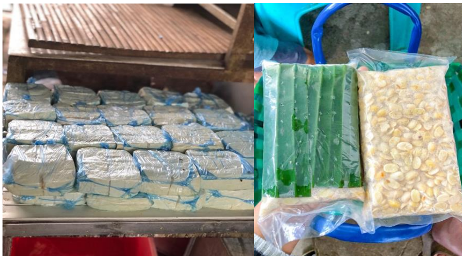
Gambar 6. Produk Output Pabrik