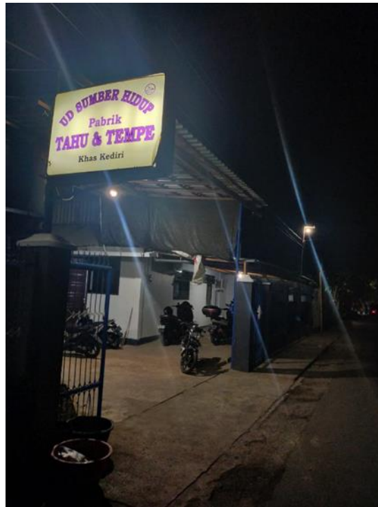
Gambar 2. Dokumentasi Pabrik

UD. Sumber Hidup (pabrik tahu dan tempe khas Kediri) merupakan salah satu dari ketiga pabrik tahu tempe yang masih beroperasi tersebut. Dalam kegiatan produksinya, UD. Sumber Hidup telah menggunakan teknologi yang terbilang canggih dibandingkan dengan pabrik kompetitornya. Sehingga membuat produk yang dihasilkan memiliki daya tarik pelanggan yang lebih baik karena keunggulannya dalam teknologi yang membuatnya terjaga dalam hala kebersihan. Memiliki desain logo, dan mendapat sertifikasi halal juga menjadi nilai plus dari pabrik tahu tempe ini. Hanya saja, pabrik belum menggunakan logo secara efisien sehingga terkadang menimbulkan adanya permasalahan tertentu. Angela Oscario (2013) menjelaskan pentingnya peranan logo dalam membangun branding dengan penuh perencanaan agar branding makin kuat dan berharga. Pabrik akan selalu mengalami perubahan, namun nilai yang terkandung dalam brand akan terus hidup.