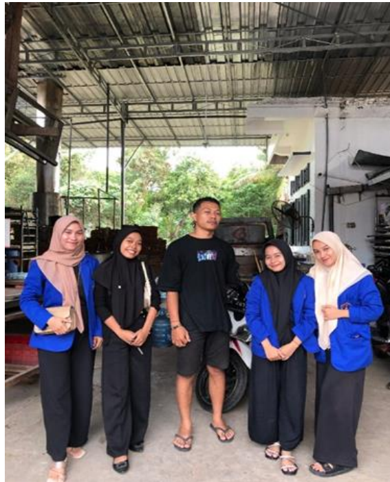
Gambar 3. Observasi

Melakukan pengunjungan UMKM UD.Sumber Hidup pabrik tahu khas Kediri mengobservasi dan berdiskusi menanyakan bagaimana permasalahan yang dihadapi oleh UMKM.