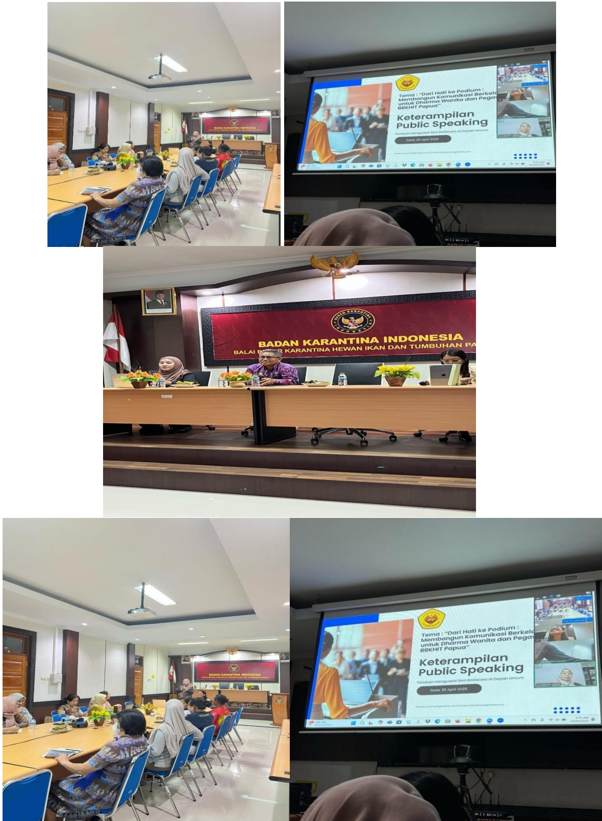
Gambar 2. Pembukaan Kegiatan dan Pelatihan Materi Teori secara Hybrid (Luring dan Daring).