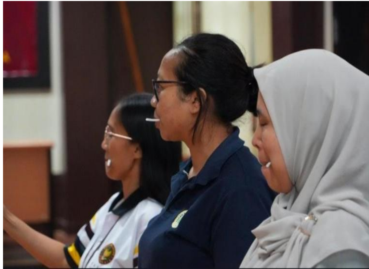
Gambar 3. Peserta Pelatihan Melakukan Latihan Vokal.

Metode latihan lokal dalam public speaking ini menggunakan teknik-teknik tertentu untuk mengoptimalkan suara agar terdengar jelas, kuat, dan menarik sehingga menimbulkan efektivitas komunikasi. Teknik ini meliputi pernapasan diafragma, artikulasi, intonasi, volume, dan proyeksi suara.