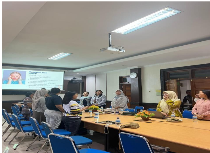
Gambar 4. Kegiatan Melatih Gesture (Bahasa Tubuh).

Latihan gesture dalam public speaking melibatkan penggunaan bahasa tubuh secara efektif untuk memperkuat pesan yang disampaikan. Ini termasuk penggunaan gerakan tangan, ekspresi wajah, kontak mata, dan postur tubuh. Latihan gesture yang baik membantu pembicara menjadi lebih percaya diri, menarik, dan mudah dipahami oleh audiens.