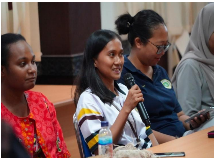
Gambar 5. Kegiatan Praktek Public Speaking dengan Diskusi Kelompok.

Public speaking adalah kemampuan menyampaikan ide, gagasan, pesan, atau pendapat di depan umum atau sekelompok orang. Ini melibatkan komunikasi lisan yang disiapkan dan dilakukan secara efektif untuk menginformasikan, menghibur, atau meyakinkan audiens. Elemen Penting Public Speaking terdiri dari persiapan. Mempersiapkan materi dengan baik, termasuk mengorganisir ide, memilih kata-kata yang tepat, dan membuat kerangka presentasi. Element berikutnya yaitu Bahasa Tubuh : Menggunakan gestur, ekspresi wajah, dan kontak mata yang mendukung penyampaian pesan; Element Suara : Menggunakan volume, intonasi, dan lafal yang jelas dan menarik perhatian audiens; Element Audiens : Menyesuaikan gaya bicara, bahasa, dan materi dengan karakteristik dan kepentingan audiens; Sesi Latihan : Berlatih menyampaikan presentasi secara berulang-ulang untuk meningkatkan kepercayaan diri dan kemampuan berbicara.