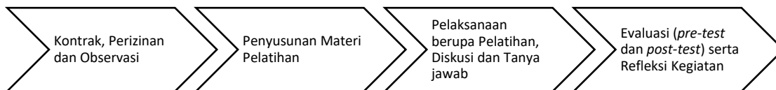
Gambar 1. Metode Pelaksanaan Pengabdian Public Speaking di BBKHIT.

Keempat : tahap evaluasi yang dilakukan berupa penyebaran kuisioner yang harus diisi oleh peserta untuk mengetahui dan mengukur tingkat pemahaman peserta yang mengikuti public speaking setelah dilakukan pelatihan (evaluasi melalui pre-test dan post-test ). Selain itu, peserta juga diberikan kuisioner yang berisi pertanyaan tertutup berkaitan dengan materi yang disampaikan, penyediaan waktu pelatihan, sarana dan prasarana, media pembelajaran, dan penilaian terhadap para narasumber/pemateri sebagai bentuk refleksi kegiatan. Tahapan yang ditempuh dapat digambarkan sebagai berikut: