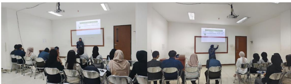
Gambar 1. Dokumentasi Kegiatan Pengabdian

Hasil evaluasi melalui pre-test dan post-test menunjukkan peningkatan signifikan dalam pemahaman akuntansi dasar dan kepatuhan pajak. Nilai rata-rata pengetahuan akuntansi meningkat dari 55% menjadi 88%, sedangkan pemahaman terkait kewajiban pajak naik dari 48% menjadi 82%.